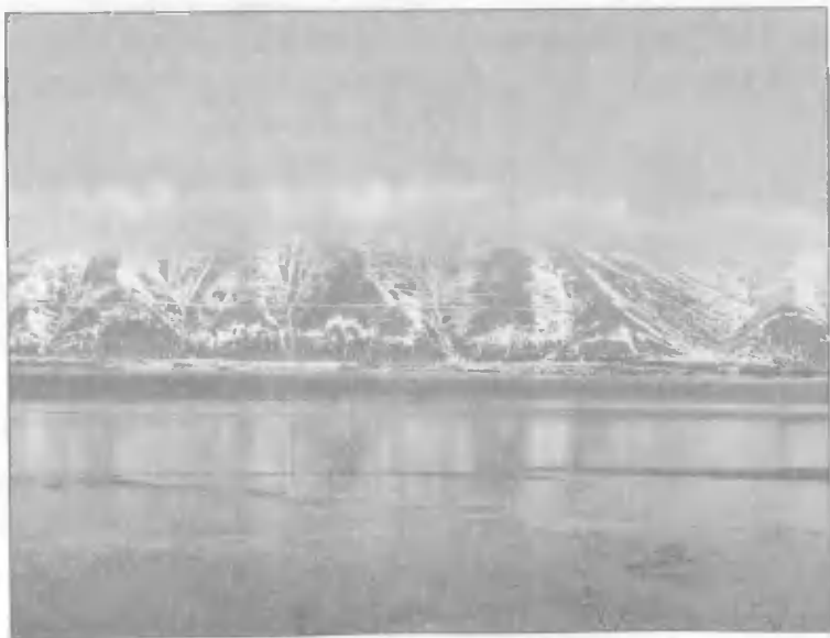
Вид на озеро Севан