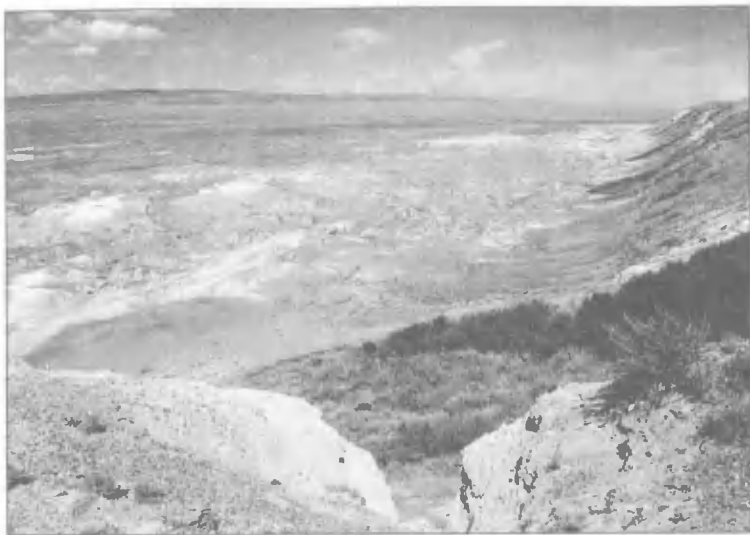
Семипалатинский ядерный полигон