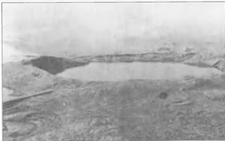
Воронка от ядерного взрыва, затопленная водой из озера Чаган, 1965 год