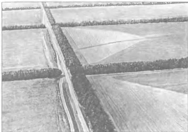
Защитные лесные насаждения