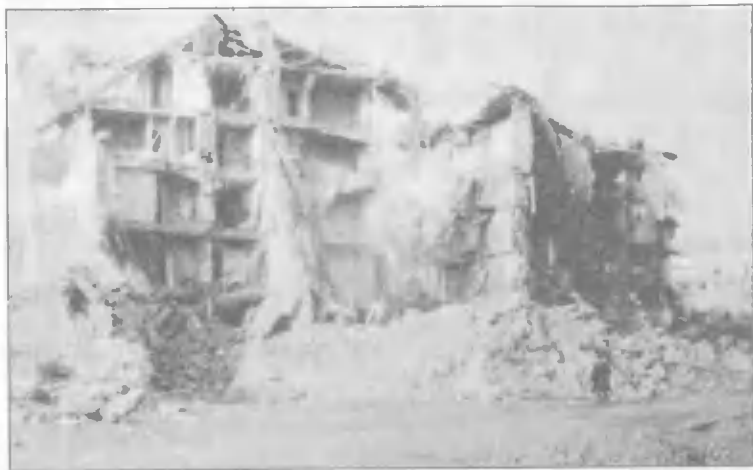
Город Спитак после землетрясения