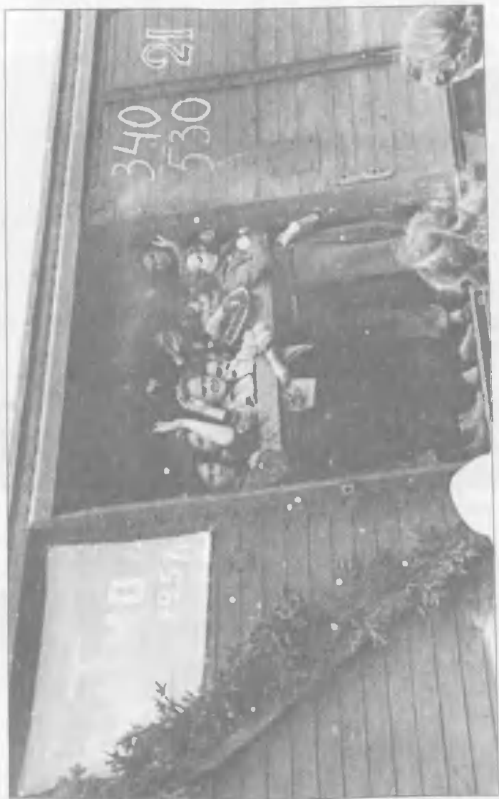
Эшелон со студентами отправляется на целину