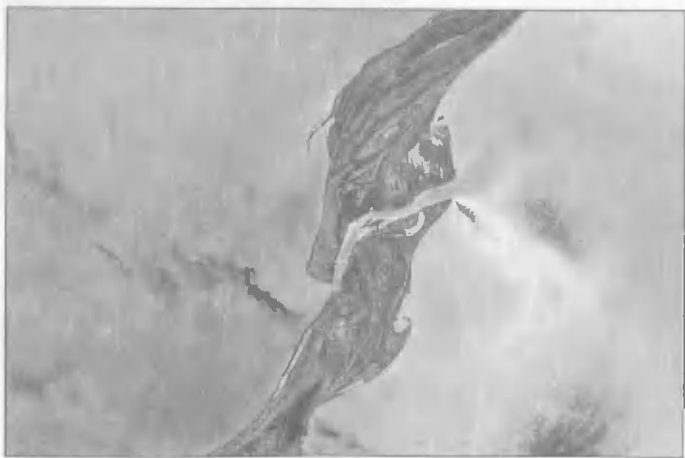
Пролив между Каспийским морем и заливом Кара-Богаз-Гол