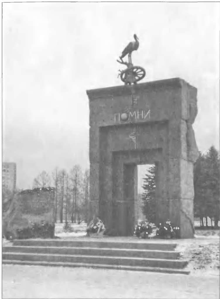
Памятник жертвам радиационных аварий и катастроф в Парке имени академика Сахарова, Санкт-Петербург