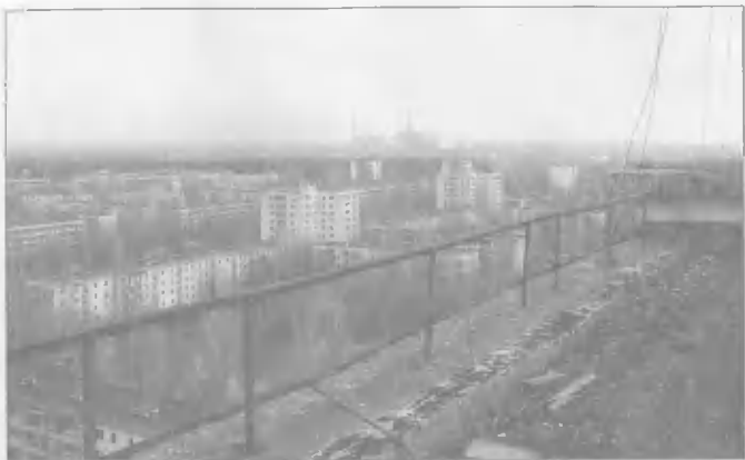
Припять — ближайший к Чернобыльской АЭС город, эвакуированный после аварии