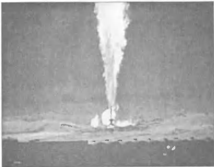
Газовый фонтан Урта-Булак был потушен ядерным взрывом в 1966 году