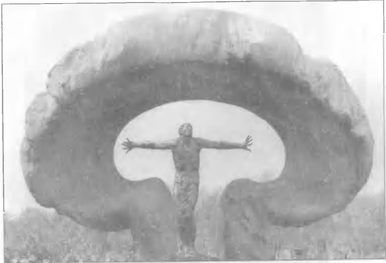
Памятник жертвам Чернобыльской аварии на Митинском кладбище в Москве