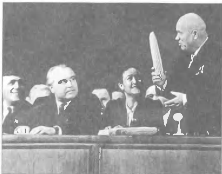
Н.С. Хрущев на совещании сельских передовиков производства в Ташкенте, 1961 год