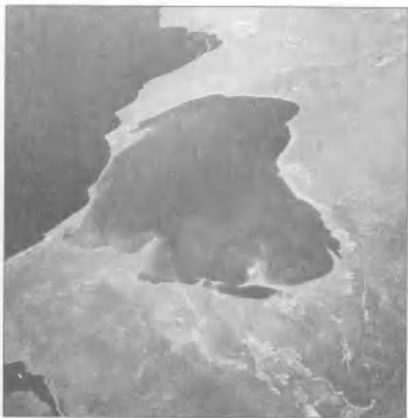
Залив Кара-Богаз-Гол в сентябре 1995 года