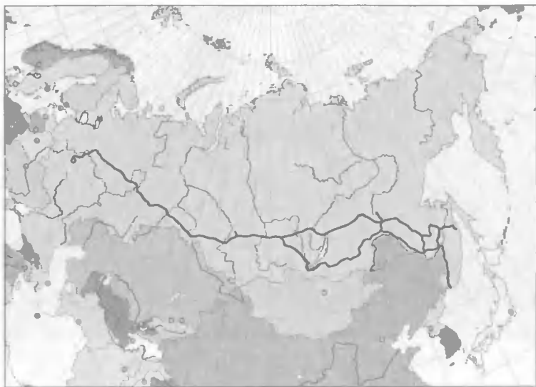
Байкало-Амурская магистраль проходит по северному побережью Байкала