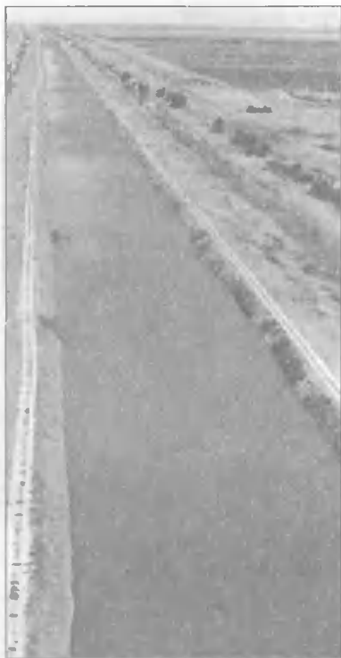
Канал Иртыш — Караганда