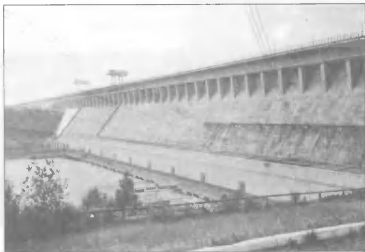
Шестая Братская ГЭС