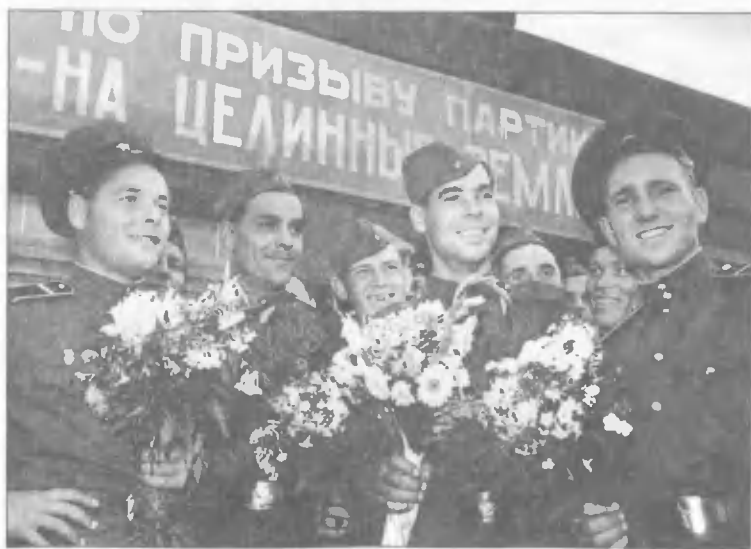
Демобилизованные солдаты отправляются на целину