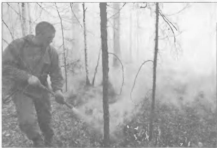
Тушение лесных пожаров в Читинской области