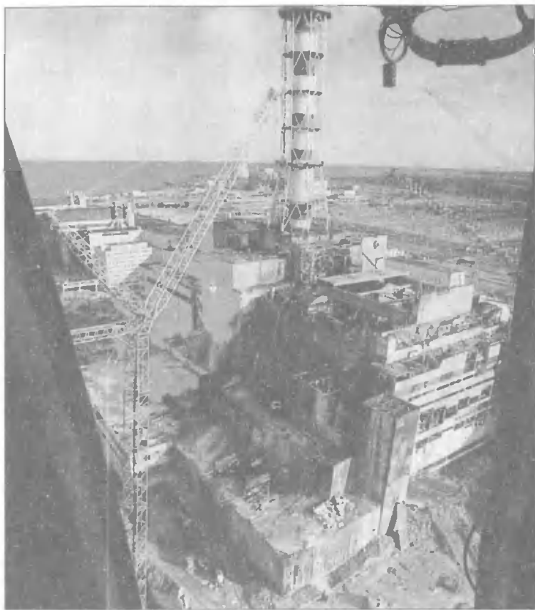
Четвертый реактор после аварии