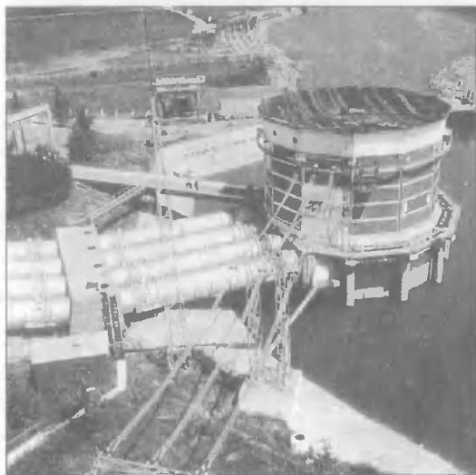
Насосная станция канала Иртыш — Караганда