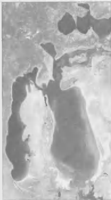
Аральское море. Спутниковые снимки: слева — 1989 год, справа — 2003 год