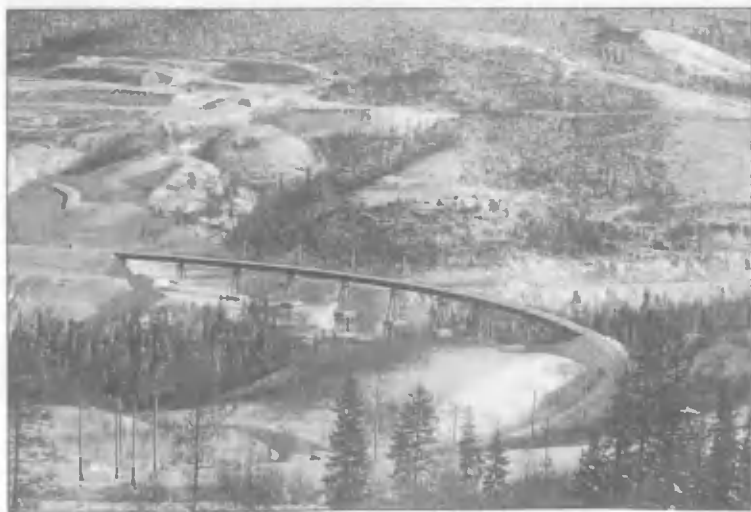
Знаменитый «Чертов мост» Северо-Муйского обхода — изогнутая эстакада на двухъярусных опорах над руслом Итыкита