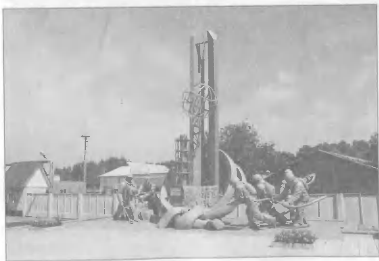
Памятник пожарным, работавшим на Чернобыльской аварии