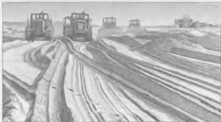
Освоение пустынных земель в совхозе «Шават»