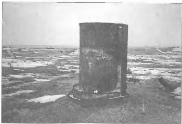
Семипалатинский ядерный полигон. Место подземного испытания