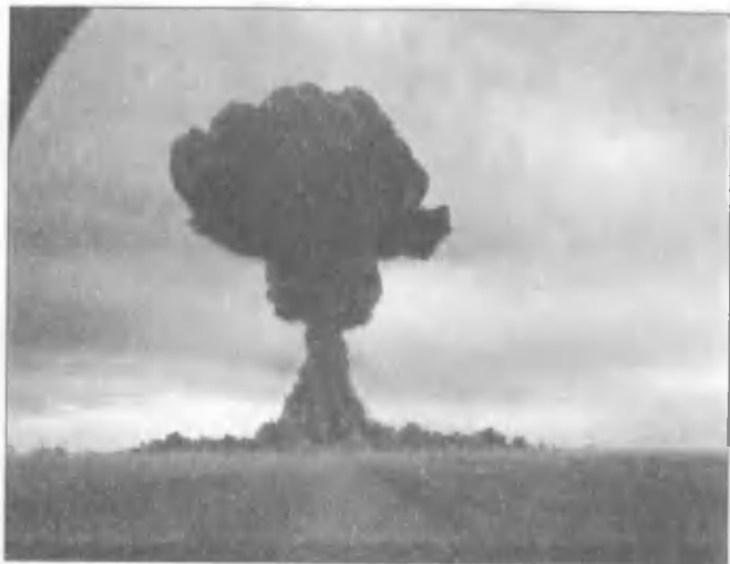
Первое испытание ядерной бомбы в Советском Союзе. Семипалатинский ядерный полигон, 1949 год