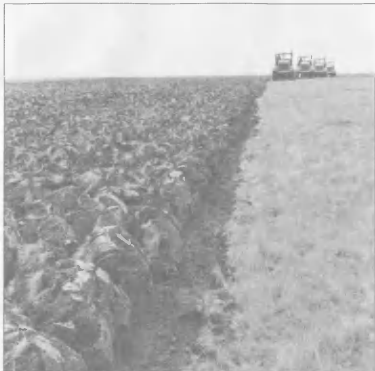
Распашка целинных земель, 1972 год